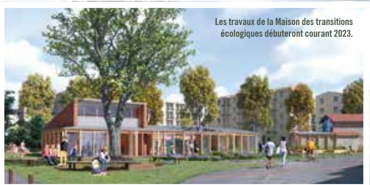
Les travaux de la Maison des transitions écologiques débuteront courant 2023.