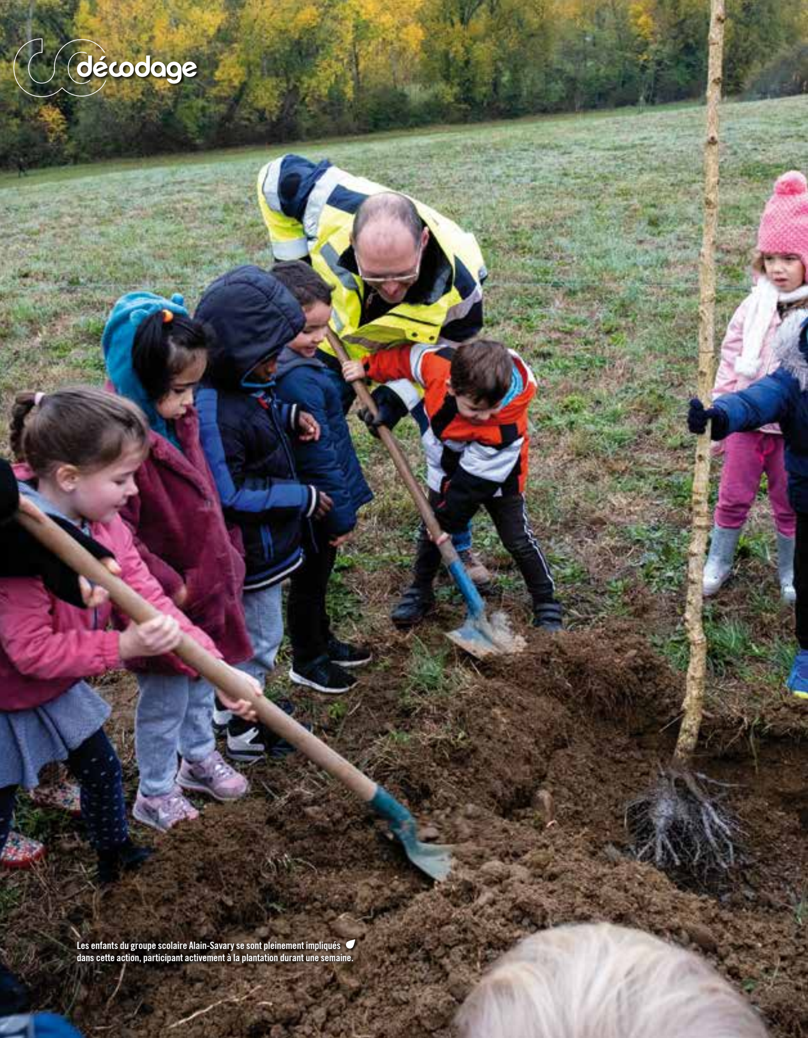
Les enfants du groupe scolaire Alain-Savary se sont pleinement impliqués dans cette action, participant activement à la plantation durant une semaine.